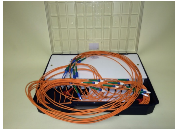
12 x 100m 50µm OM2, SC, LC